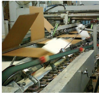
Plegadora. Correa Toptrans.