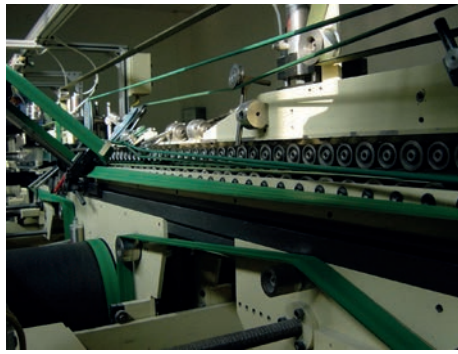
Correa Toptrans EE10/3 en plegadora de cartones de tabaco.