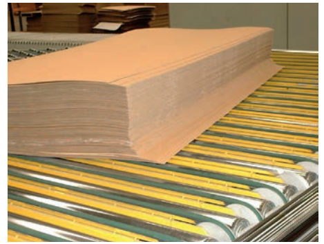
Apiladora. Correa redonda RS88L15.