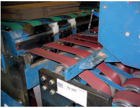
Encoladora. ASTER 24QF en líneas Emba Casemaker 1.6 y 2.9.